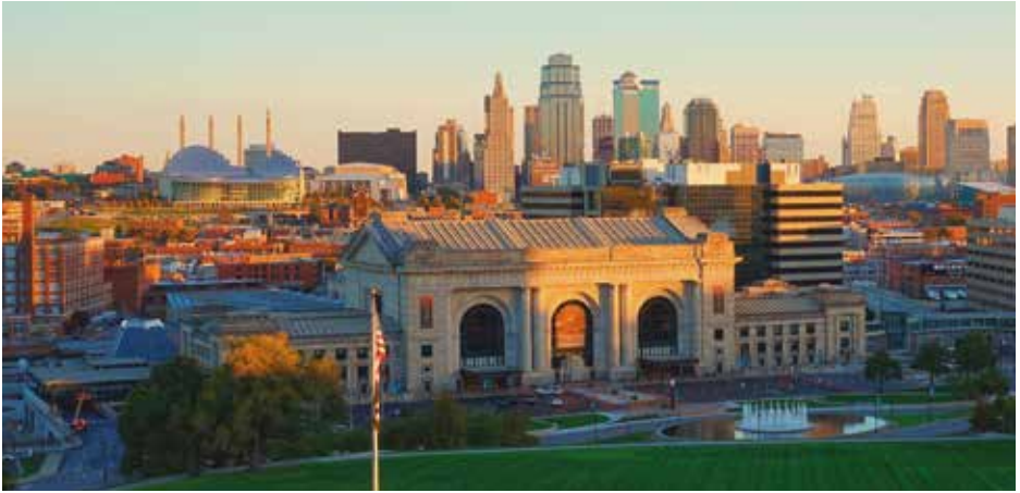
Union Station Kansas City und die Skyline der Stadt.

von Menschenhand geschaffene Denkmal in den USA ist. Von seiner Aussichtsplattform aus sieht man auch das hübsche Old Courthouse sowie das markante, aus roten Backsteinen erbaute Busch Stadium – Heimat des Baseballteams St. Louis Cardinals.