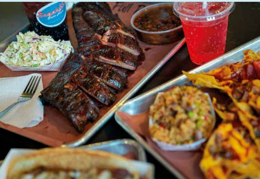
Einfach köstlich: Rippchen im Sugarfire Smoke House in St. Louis.