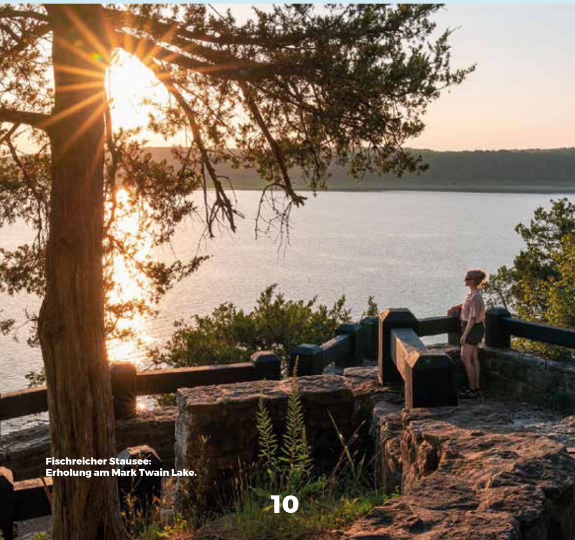
Fischreicher Stausee: Erholung am Mark Twain Lake.

Viele natürliche Attraktionen liegen allerdings versteckt unter der Erdoberfläche. In Missouri gibt es über 7.500 Höhlen, weswegen der Staat auch als „Cave State“ bekannt ist. Warum es hier so viele sind? Das liegt am Kalkstein, der über Jahrhunderte hinweg von Wasser ausgewaschen