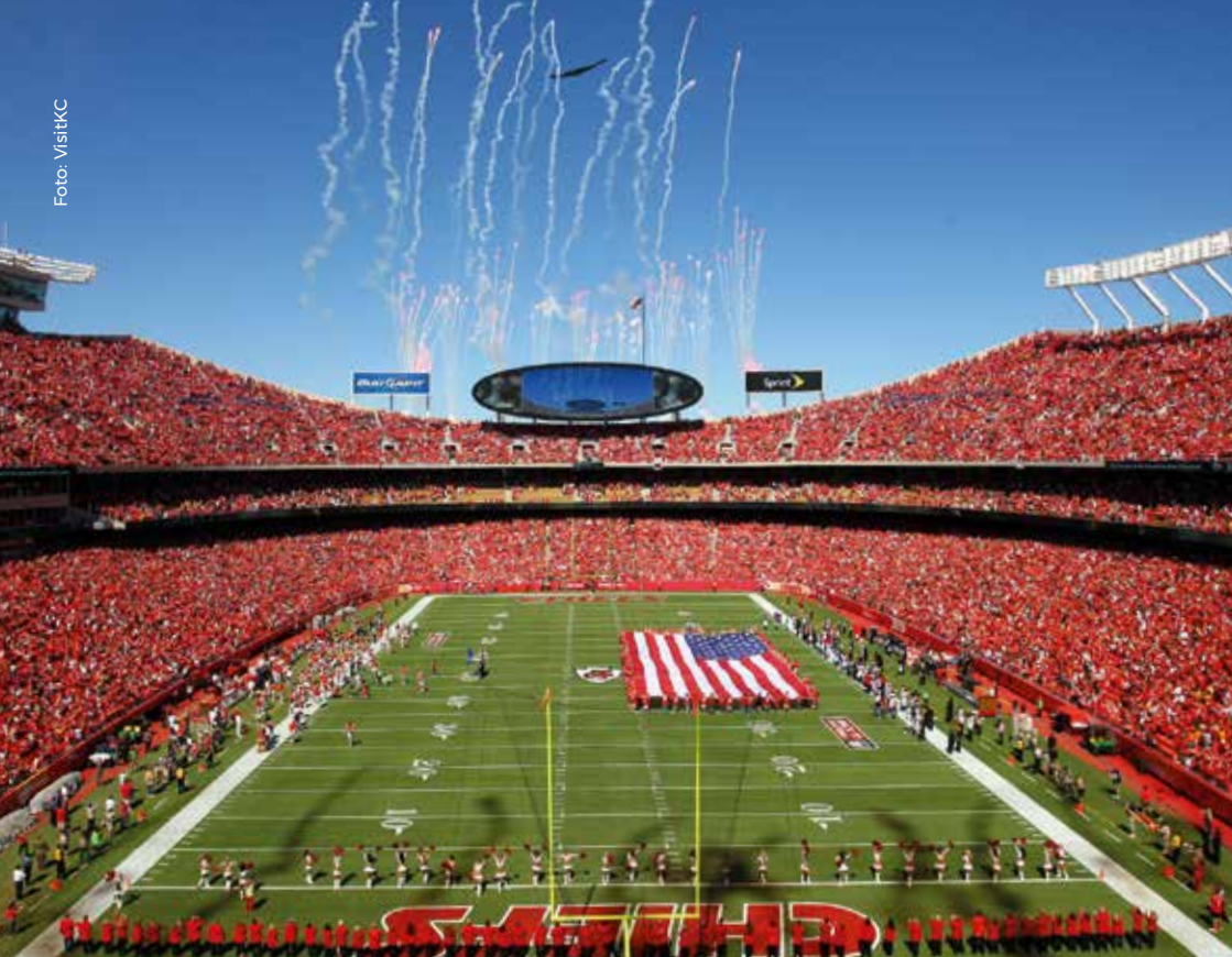
Stadion der Kansas City Chiefs.