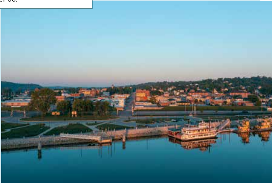
Missouri zweiter Fluss: der Mississippi.

mit vielen Tasting-Möglichkeiten. Und der Highway 19 über die Ozark National Scenic Riverways und durch den Mark Twain National Forest – eine Traumroute für Biker, speziell zur Laubverfärbung im Herbst.